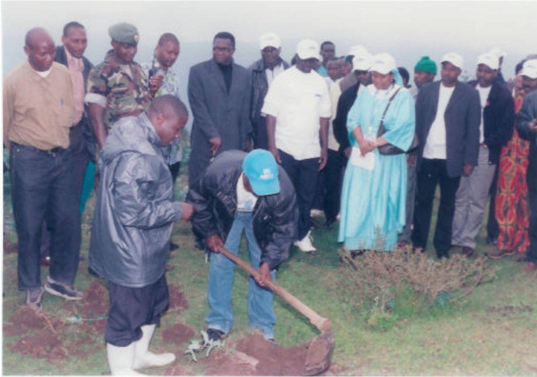
Plantation d'arbres à Byumba