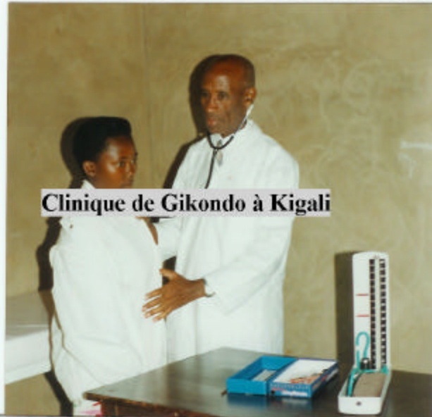
Clinique de Gikondo à Kigali