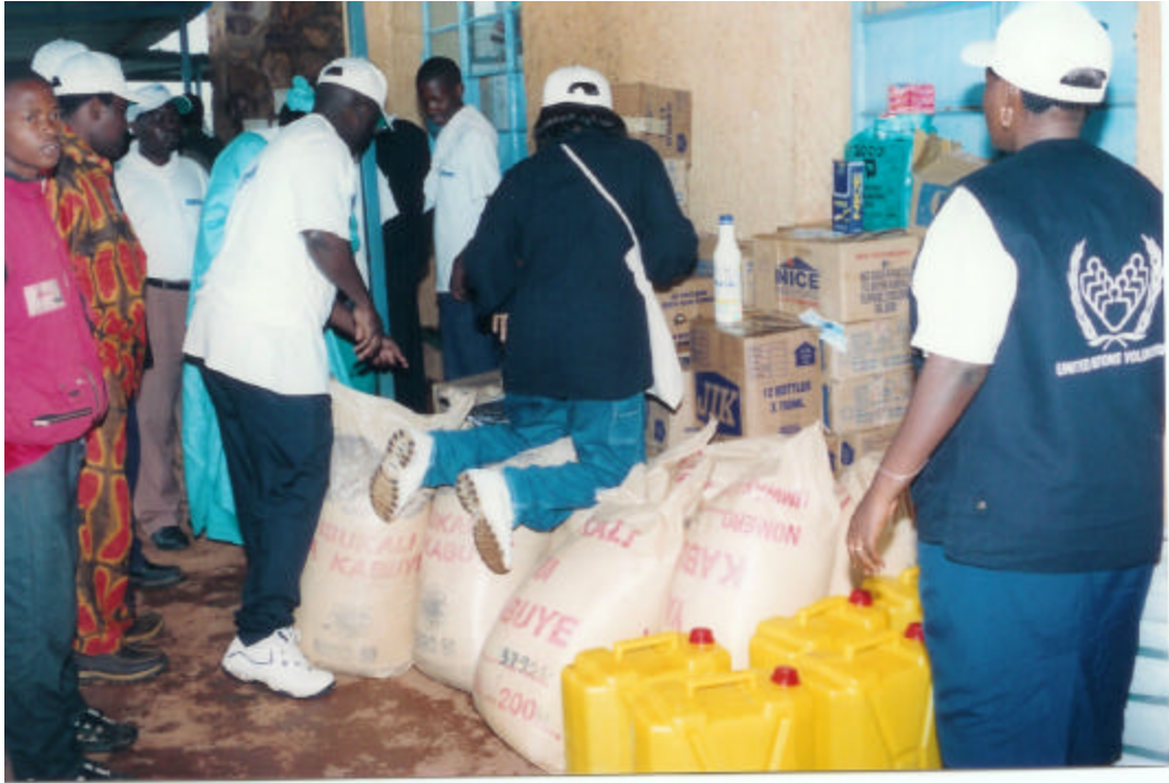
Remise des dons à l'hôpital de Byumba